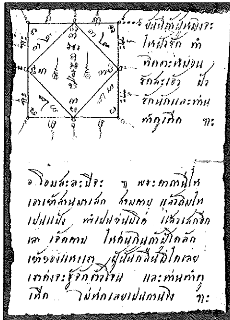
ยันต์นี้ถ้าผู้หญิงจะให้ผัวรักทำติดตะหมอน (ลูกบิด) รัดสะเฮอร์ ผัวรักนิกและท่านทำดูเทิด ๆ