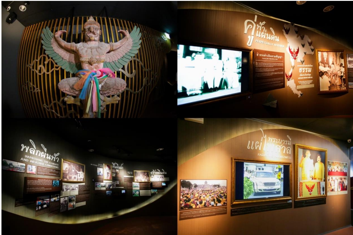
ส่วนจัดแสดงที่ 6 ห้องจัดแสดงครุฑ “ครุฑ” ต้นแบบความซื่อสัตย์ トラตั้งห้างพระราชทาน